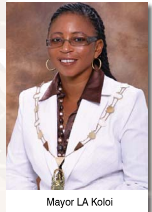
Mayor LA Koloji

Voertuie word nie op die grasperke van die munisipale parke toegelaat nie. Daar word ook 'n beroep gedoen op alle inwoners om vandalisme te rapporteer by 054 338 7177 of 054 338 7164.