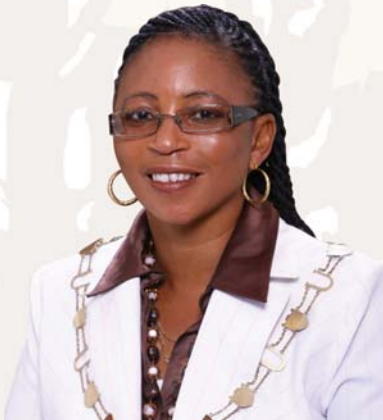
Burgemeester Rdl LA Koloï

Munisipaliteit //Khara Hais het ontdek dat baie mense buite die grenslyn van hulle eiendomme bou en ook nie by die bou regulasies hou nie.